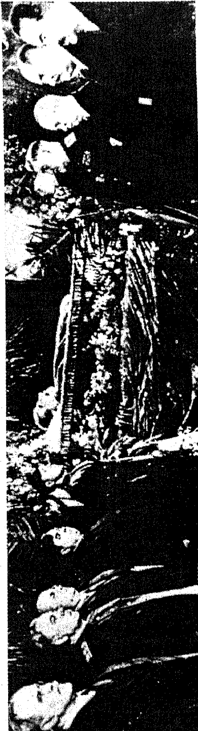
حول نعش ستالين في الكرملين: من اليسار: مولوتوف، فوروشيلوف، بيريا ومالينكوف من اليمين: بولغانين، خروتشوف، كاغانوفيتش